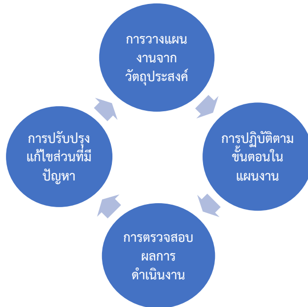
ภาพที่ 1 แนวทางการพัฒนาศักยภาพการท่องเที่ยวอุทยานประวัติศาสตร์พระนครคีรี (เขาวัง)