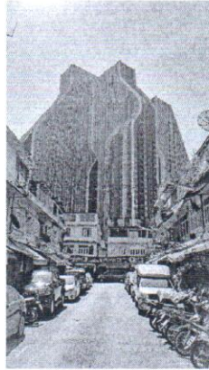
ชื่อภาพ “มหานคร”

เป็นภาพที่เห็นอาคารเก่าในอดีตอยู่บริเวณหน้า ด้านหลังเป็นคอนโดมิเนียมที่สร้างขึ้นมาใหม่ บันทึกภาพที่ชุมชนสามย่าน กรุงเทพมหานคร