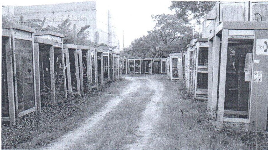
ชื่อภาพ “แต่ทุกความทรงจำ”

เป็นภาพสภาพการจราจรที่หนาแน่น แวดล้อมไปด้วยตึกอาคารทั้งเก่าและใหม่ มีเสาของรถไฟฟ้าเป็นแกนกลางของภาพ บันทึกภาพที่สะพานลอยข้ามถนนจากฝั่งโรงพยาบาลนครสกลา ไปยังห้างสรรพสินค้าสยามเซ็นเตอร์ เขตปทุมวัน กรุงเทพมหานคร