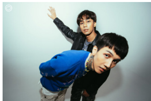
ภาพประกอบที่ 3 ศิลปินวง Paper Planes

จากตัวอย่างทฤษฎีที่เกี่ยวข้องกับการเลือกอาชีพอาจสามารถสรุปได้ว่า หากบุคคลใดเลือกประกอบอาชีพที่เหมาะสมและสอดคล้องกับความเป็นตัวเองก็จะมีโอกาสที่จะประสบความสำเร็จและมีความสุข ซึ่งความสุขนั้นก็อาจหมายถึงการได้ประกอบอาชีพที่ฝันไว้ โดยการที่ใครสักคนจะเรียกอาชีพใดอาชีพหนึ่งว่าอาชีพในฝันได้นั้น ย่อมต้องมาจากหลายเหตุผลประกอบกัน เช่น ความประทับใจจากเหตุผลใดเหตุผลหนึ่ง ความชอบและความพึงพอใจของตัวเองซึ่งอาจมาจากอุปนิสัยหรือบุคลิกของตนดังที่ทฤษฎีการเลือกอาชีพ ของ John L. Holland กล่าวไว้ หรือจากเหตุผลใดๆก็ตามแต่เหตุผลของแต่ละบุคคล แต่สิ่งที่เห็นได้ชัดตามที่ได้กล่าวมาก่อนหน้านี้ก็คือ อาชีพนักร้องนักดนตรีคืออาชีพในฝันลำดับต้นๆของคนไทย เป็นอาชีพที่สามารถทำให้คนที่ประกอบอาชีพประสบความสำเร็จ มีชื่อเสียงและรายได้และมีอิทธิพลต่อสังคมอย่างชัดเจนไม่ว่าเวลาจะผ่านไปกี่ยุคก็สมัย ซึ่งหากจะยกตัวอย่างศิลปินนักร้องนักดนตรีที่มีอิทธิพลต่อสังคมที่น่าสนใจในปัจจุบันก็คงต้องกล่าวถึงศิลปินวง Paper Planes (ภาพที่ 3)