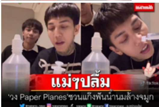
ภาพประกอบที่ 4 ชาว ศิลปินวง paper planes

จากที่กล่าวถึงอาชีพนักร้องนักดนตรีในมิติ