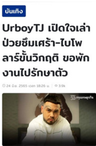
ภาพประกอบที่ 8 จิรายุทธ ฝโลประการ หรือ UrboyTJ แร็ปเปอร์ นักดนตรีและโปรดิวเซอร์ไทยชื่อดัง

และส่วนตัว หรืออาจเป็นข่าวเศร้าถึงขั้นทำ อัตวินิบาตกรรมก็ยังมีให้เห็นอยู่เสมอ