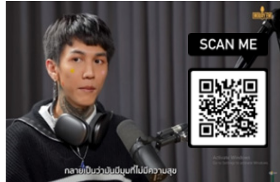
ภาพประกอบที่ 7