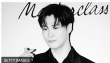
ภาพประกอบที่ 9 มุนบินวงแอสโตร (Astro) ศิลปิน K-pop ชื่อดังชาวเกาหลีใต้