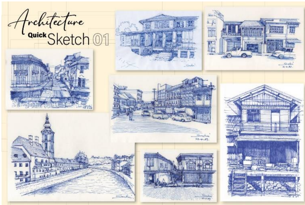
ผลงานสร้างสรรค์ "Architecture Quick Sketch No.1"