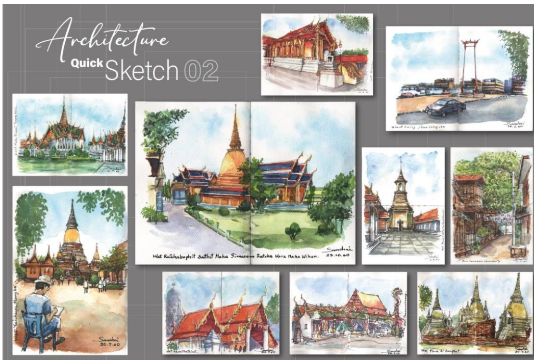
ผลงานสร้างสรรค์ "Architecture Quick Sketch No.2"