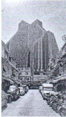
ชื่อภาพ “มหานคร”

เป็นภาพที่เห็นอาคารเก่าในอดีตอยู่บริเวณหน้า ด้านหลังเป็นคอนโดมิเนียมที่สร้างขึ้นมาใหม่ บันทึกภาพที่ชุมชนสามย่าน กรุงเทพมหานคร