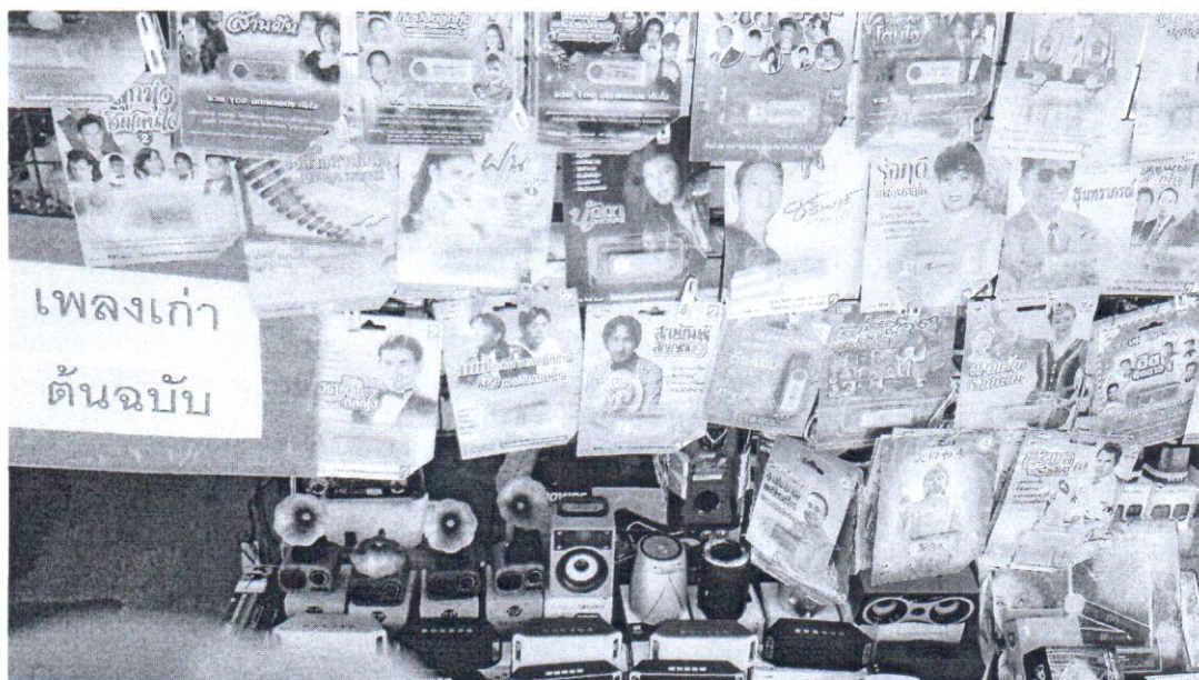
ชื่อภาพ “อัลบั้มเก่าในร่างใหม่”

ผลจากการทดลองใช้กล้องโทรศัพท์สมาร์ทโฟน SAMSUNG Galaxy J7 และนำมาปรับแต่งภาพด้วยแอปพลิเคชัน Adobe Lightroom CC ทำให้สามารถบันทึกภาพต่างๆได้ดังนี้