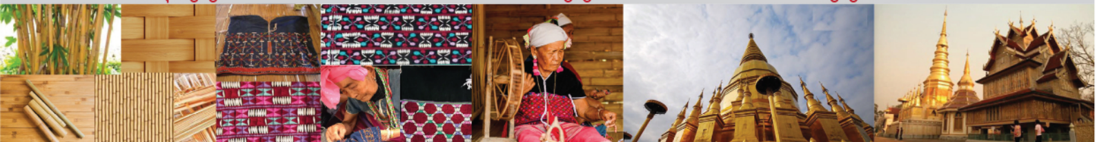
สัญญาวัฒนธรรม