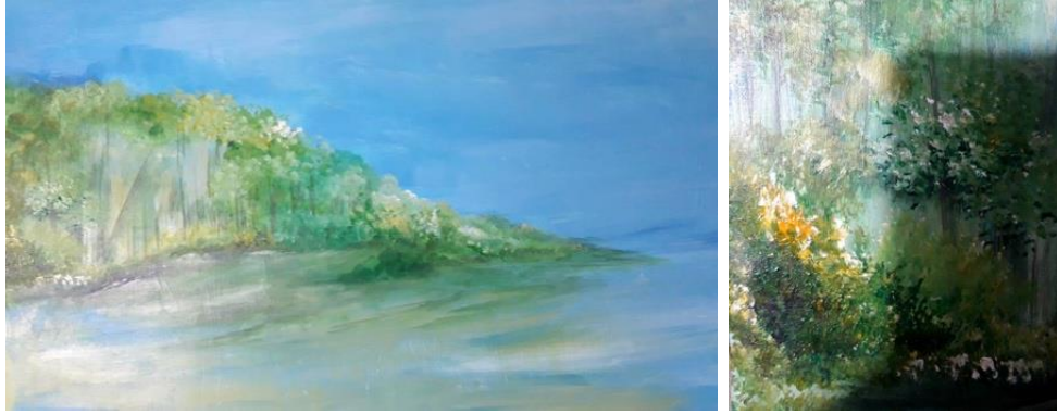
การร่างภาพและจัดวางองค์ประกอบด้วยสีอะคริลิกบนแผ่นเฟรมผ้าใบ