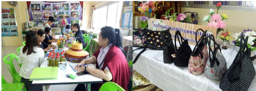
รูปที่ 1 ประสานงานเก็บรวบรวมข้อมูลการวิจัยชมรมผู้สูงอายุตำบลหนองแวน

3. ประเมินความพึงพอใจการใช้งานต้นแบบเว็บไซต์ในการส่งเสริมการขายสินค้าของชมรมผู้สูงอายุฯ ทดสอบต้นแบบเว็บไซต์โดยการประเมินความพึงพอใจการใช้งานต้นแบบ โดยทดลองใช้ต้นแบบจากสมาชิกชมรมผู้สูงอายุ จำนวน 60 คน โดยแบบสอบถาม