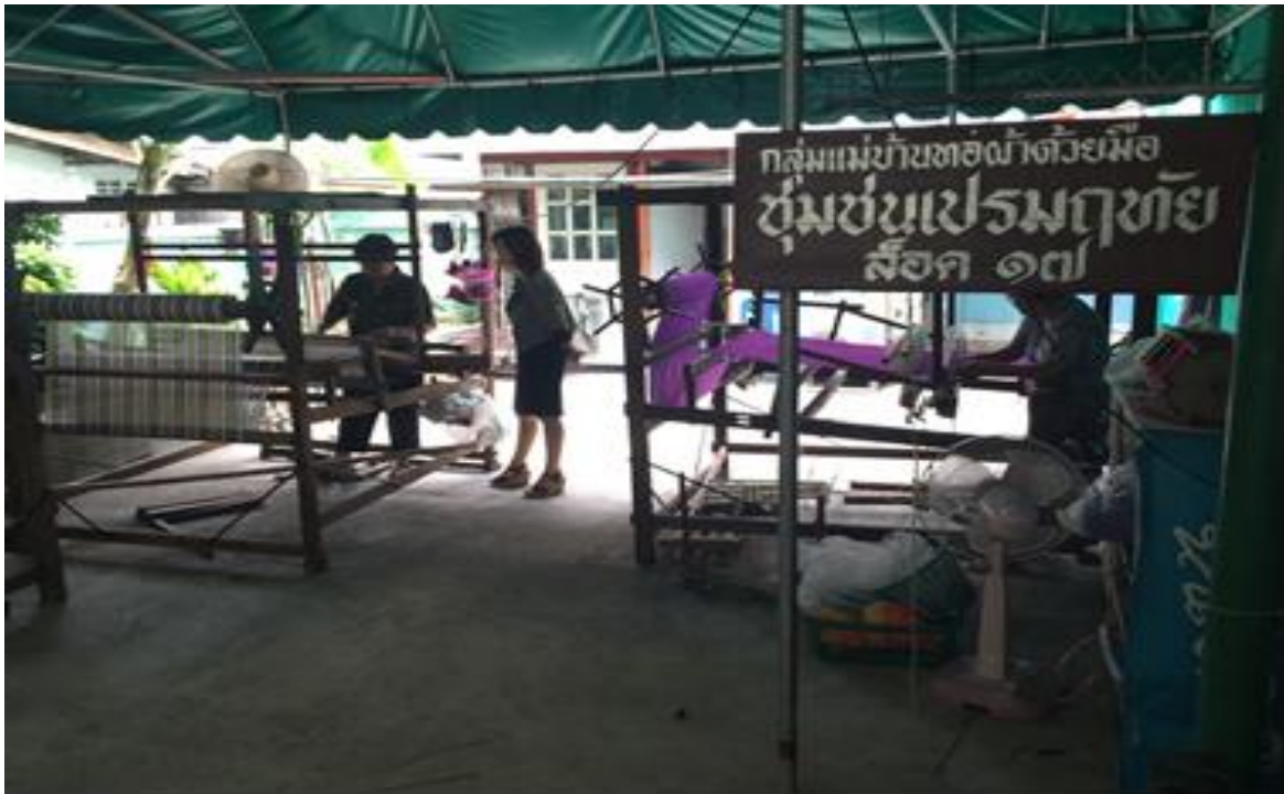
ภาพประกอบที่ 2 ลักษณะกิจกรรมกลุ่มแม่บ้านทอผ้าด้วยมือ