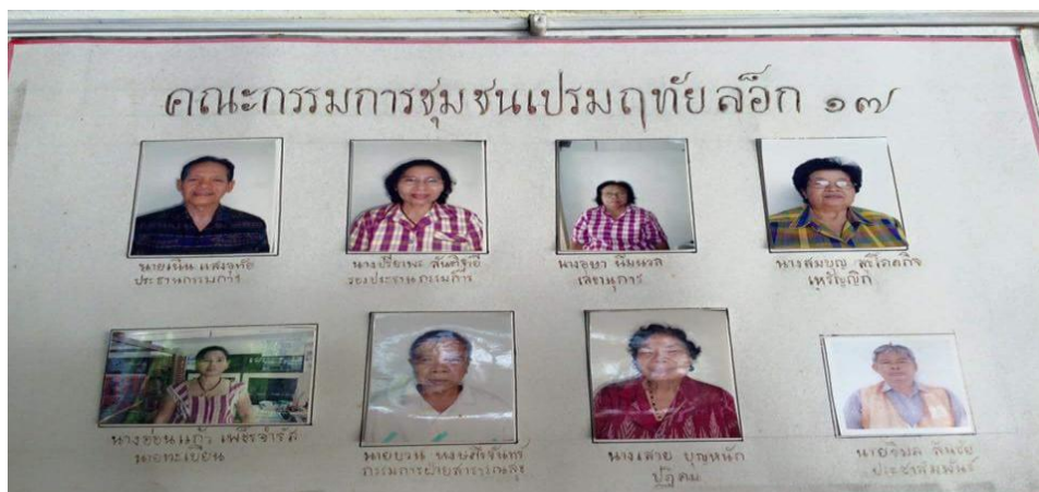
ภาพประกอบที่ 1 คณะกรรมการชุมชนเปรมฤทัย ลีอศ 17

การวิเคราะห์ข้อมูล ผู้วิจัยใช้การวิเคราะห์สรุปลุบัย (Analytic Induction) ในการนำข้อมูลที่ได้จากสภาพการดำเนินงานที่เกิดขึ้นมาวิเคราะห์เพื่อหาบทสรุป จากข้อมูลที่ได้มาจากการวิเคราะห์เอกสาร การสังเกต และการสัมภาษณ์