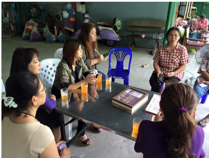
ภาพประกอบที่ 5 กิจกรรมการเพิ่มศักยภาพชุมชน