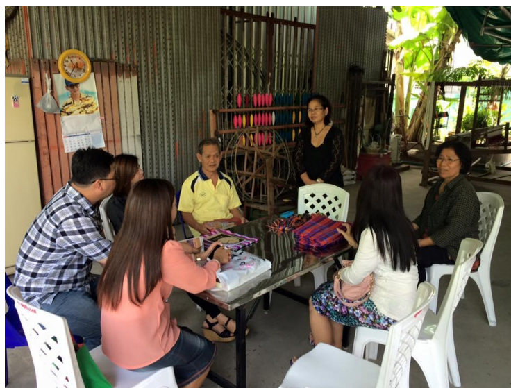
ภาพที่ 4 การสัมภาษณ์แบบไม่เป็นทางการ

5. ผู้นำชุมชน ถ้าผู้นำชุมชนมีวิสัยทัศน์ด้านการทำธุรกิจชุมชนที่แท้จริง จะสามารถเป็นแนวทางการแก้ไขหลักของปัญหาของการรวมกลุ่มที่เป็นปึกแผ่น หากผู้นำชุมชนนำไปประยุกต์ใช้จริงและช่วยสนับสนุนในการดำเนินกิจกรรมต่างๆของชุมชน จะช่วยเสริมสร้างศักยภาพให้กับชุมชนได้อีกทางหนึ่ง