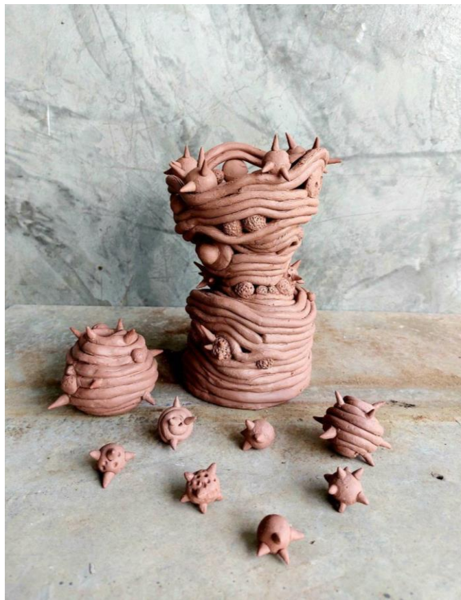
ผลงานการออกแบบเซรามิคชุด “My Vase”

ผลงานการออกแบบเซรามิค เทคนิคการขุดดินเทอราคอตตา (Terracotta)