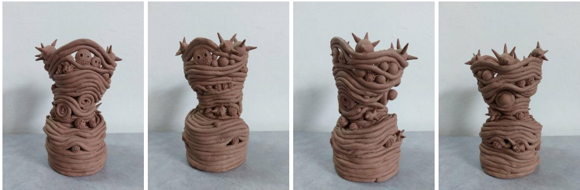
รูปด้าน ผลงานการออกแบบเซรามิก เทคนิคการขุดดินเทอราคอตตา (Terracotta)