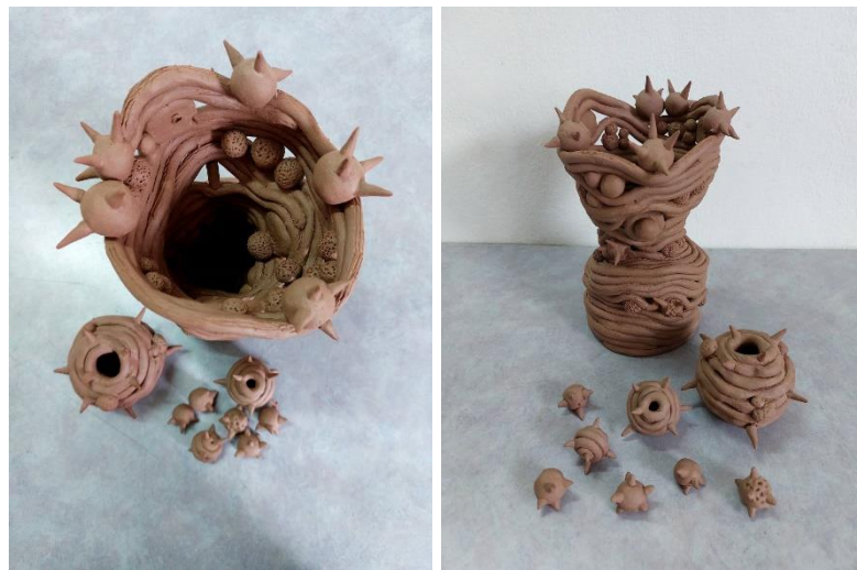
มุมมองด้านบน ผลงานการออกแบบเซรามิก เทคนิคการขุดดินเทอราคอตตา (Terracotta)