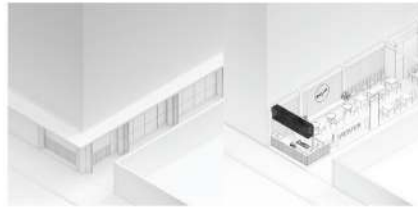
FURNITURE LAY OUT PLAN