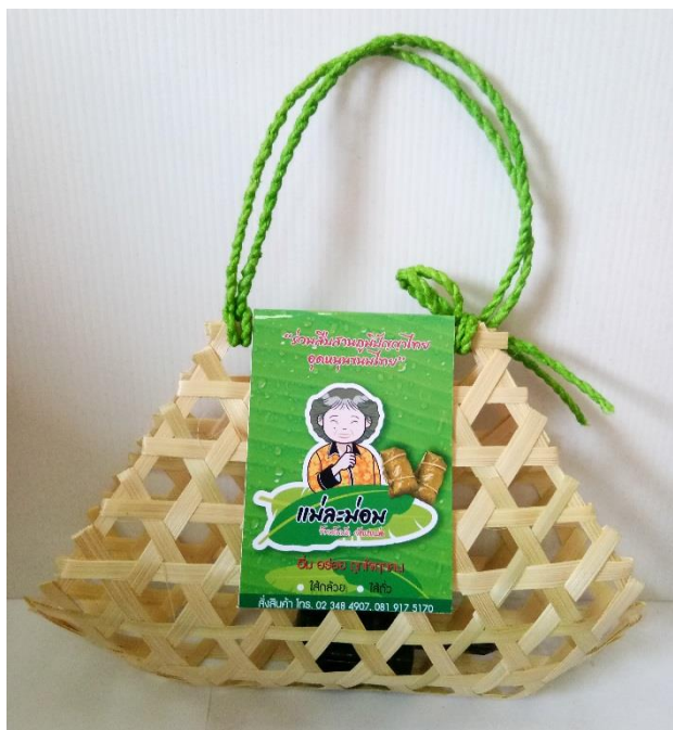
ภาพที่ 3 ผลงานออกแบบบรรจุภัณฑ์ ร้านข้าวต้มมัด “แม่ละม่อม”