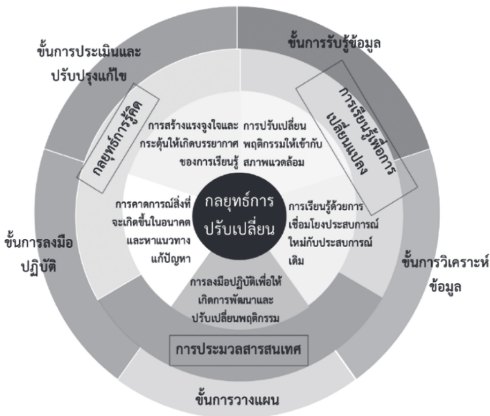
แผนภาพที่ 1 กลยุทธ์การปรับเปลี่ยนเพื่อเสริมสร้างศักยภาพในการทำงานของนักรักษาพยาบาลบำบัดยุคใหม่

2. ผลการพัฒนากลยุทธ์การปรับเปลี่ยนเพื่อเสริมสร้างศักยภาพในการทำงานของนักรักษาพยาบาลบำบัดยุคใหม่ การพัฒนากลยุทธ์การปรับเปลี่ยนเพื่อเสริมสร้างศักยภาพในการทำงานของนักรักษาพยาบาลบำบัดยุคใหม่สามารถอธิบายได้ด้วยแผนภาพที่ 1 ดังนี้