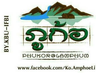
ภาพที่ 1 ผลงานออกแบบตราสัญลักษณ์กลุ่มวิสาหกิจชุมชน ตำบลท้อ อำเภอลี้ จังหวัดลำพูน “ภูท้อ”