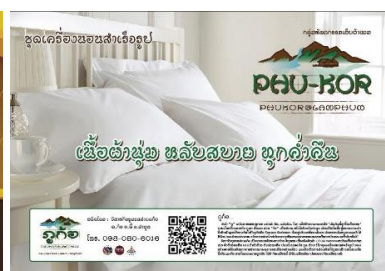
ภาพที่ 2 การนำตราสัญลักษณ์ไปประยุกต์ใช้ในสื่อประชาสัมพันธ์รูปแบบต่าง ๆ