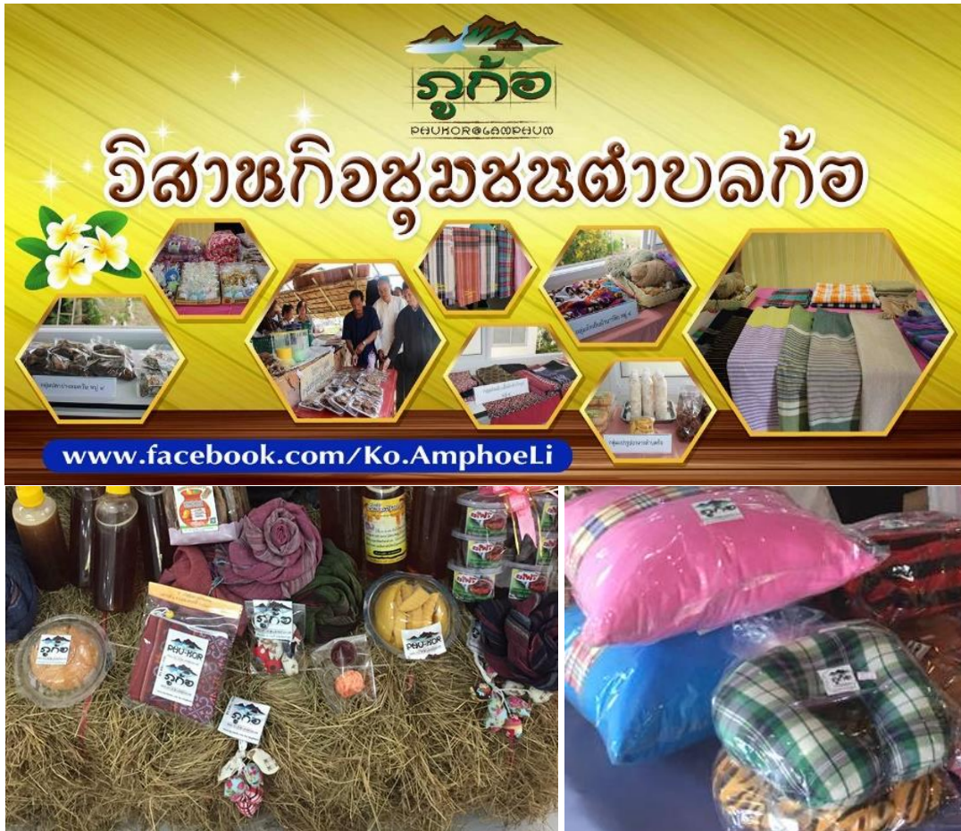
ภาพที่ 3 การนำตราสัญลักษณ์ไปประยุกต์ใช้ร่วมกับบรรจุภัณฑ์ประเภทต่าง ๆ