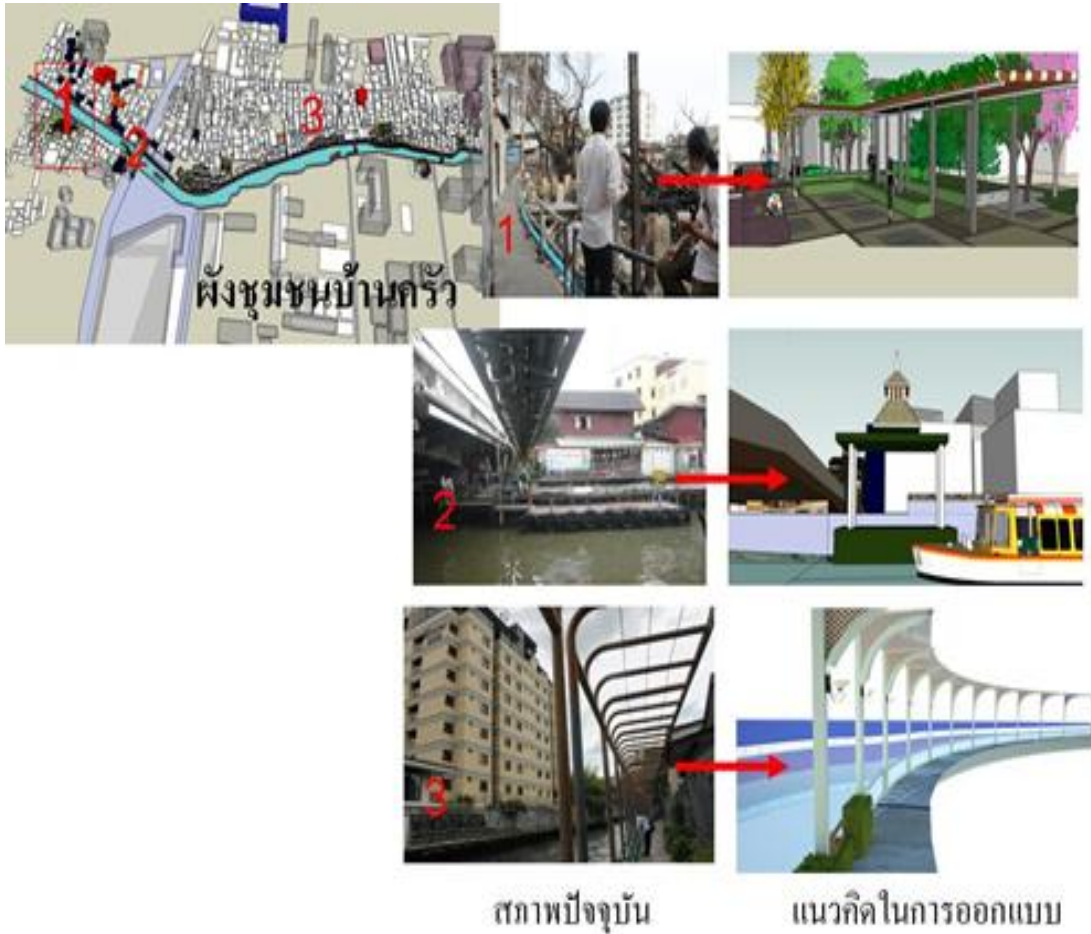
ภาพที่ 4 ทศนียภาพเสนอแนะแนวทางการพัฒนาชุมชนบ้านครัวให้เป็นชุมชนที่มีภูมิทัศน์ที่สวยงาม