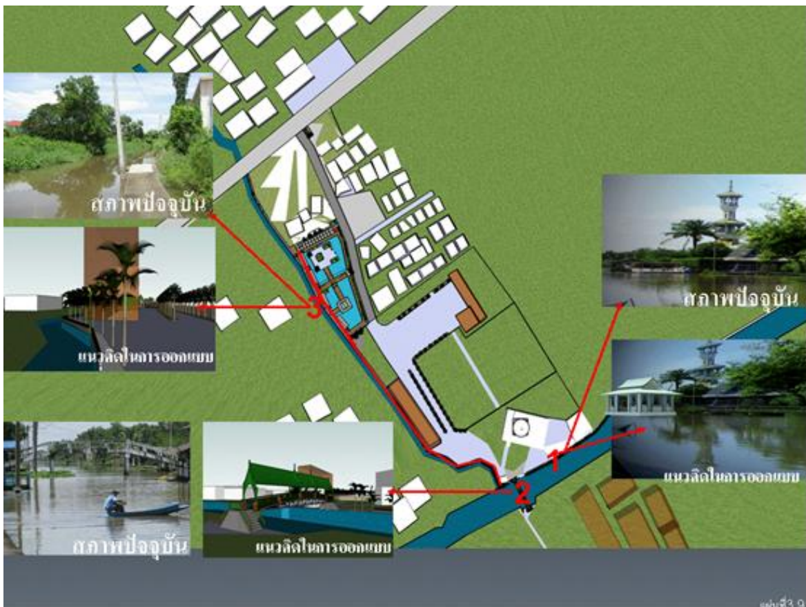
ภาพที่ 3 แสดงระบบพัฒนาทางเท้าและท่าเรือริมคลอง ชุมชนทรายกองดิน

-พัฒนาปรับปรุงท่าเรือให้เกิดความแข็งแรง ปลอดภัย และมีอัตลักษณ์ที่เหมาะสมกับชุมชน