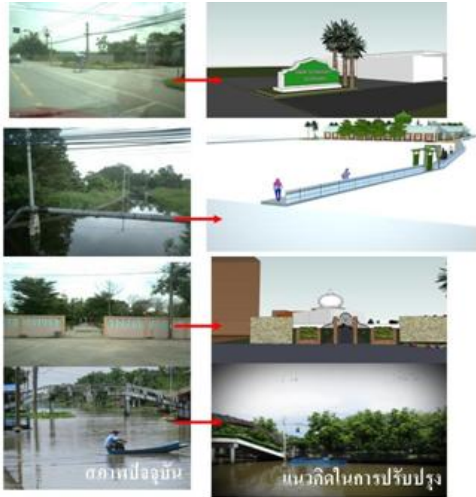
ภาพที่ 6 ทศนียภาพเสนอแนะแนวทางการพัฒนาชุมชนทรายกองดินให้เป็นชุมชนที่มีภูมิทัศน์ที่สวยงาม