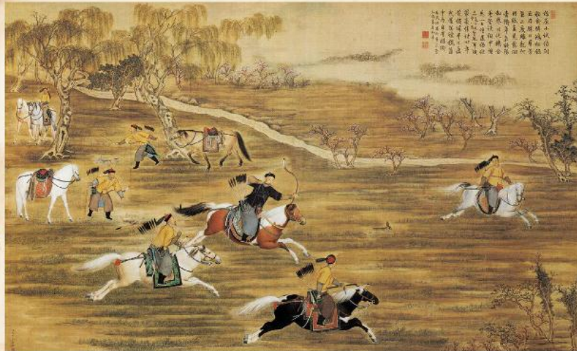
จักรพรรดิเขียนหลงเคีจ้จประพาลล่ากระต่าย โดย รุจเฉไป ศิลปินคังฮิวเน (กลางชื่อหนึ่ง) พ.ศ. 2298 จิตรกรรมจีนประเพณี หนักและสีบนผ้าไหม 2

“แผ่นดินเขียนหลง ปีที่ 46 จีนทิวเจี๋ยงวัย (ตรง ณ เดือนสามปีฉลูจุลศักราช 1143 ปี) เลี่ยมหลอก๊กก๊กเจี๋ยจ้แต่เจี๋ยว (พระเจ้ากรุงสยาม เรียกว่าเจี๋ยงนั้นกรุงจีน ยังไม่ได้ยกย่อง แต่เจี๋ยวพระนามสมเด็จพระเจ้ากรุงธนบุรีที่บอกไปในภาษาจีน) ให้หลงปีไชขามี่ (หลวงพิไชยธานีหรือเพ็ชรปानी) กับเฮ้อกบู๊ตุด (อุปทูต) สองนาย