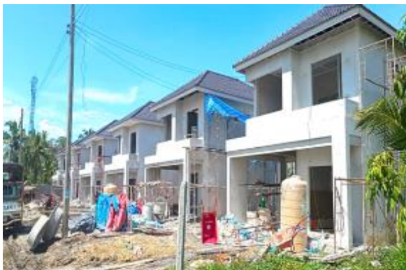
ภาพที่ 1 สภาพปัญหาบ้านที่ค้างของโครงการ

จากการเก็บข้อมูลปัญหาของกระบวนการดำเนินการก่อสร้างขาย พบว่า มีปัญหาของด้านต้นทุนจม ไม่สามารถรับรายได้ตามเป้าหมาย เนื่องจากทำเลของการดำเนินการ จำนวนประชากร รวมถึงรายได้จากแหล่งชุมชน ทำให้เกิดการสต็อกบ้านในโครงการ และเกิดการชะลองานของผู้รับเหมา